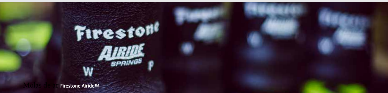
Molas de ar Firestone Airide™

R: Notifique imediatamente o seu supervisor, o gerente ambiental da localidade, a Auditoria Interna, o Departamento Jurídico ou a Bridgeline e forneça os detalhes.