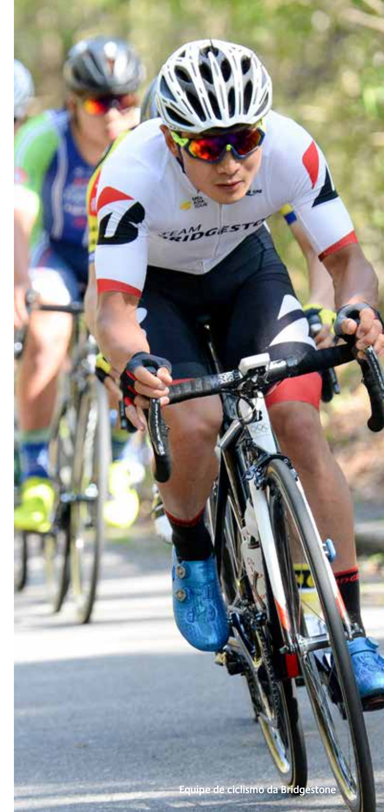
Equipe de ciclismo da Bridgestone