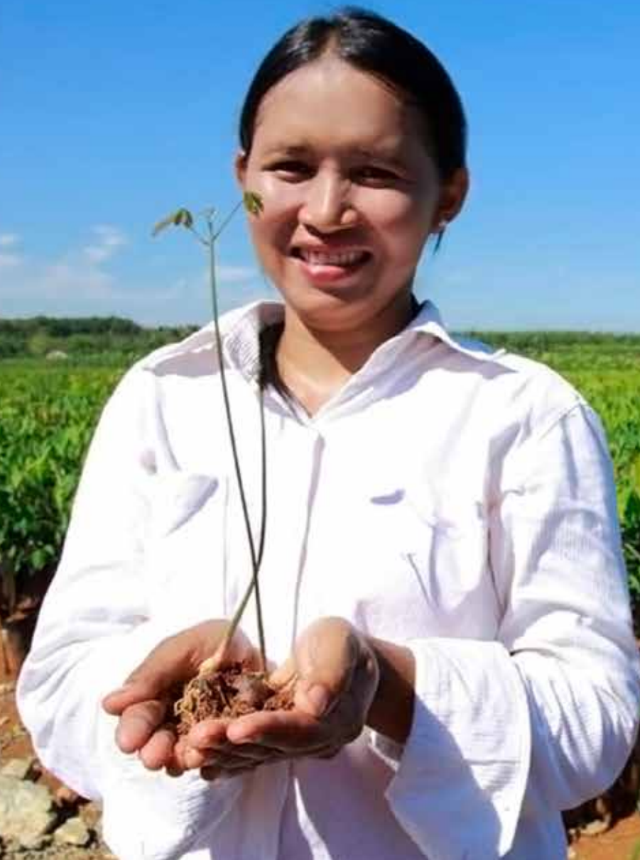
Fábrica da Bridgestone em Kalimantan, Indonésia