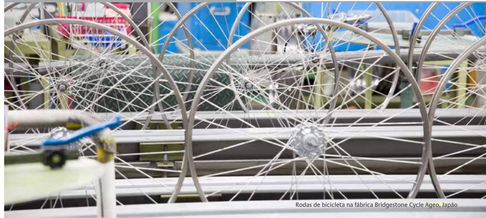
Rodas de bicicleta na fábrica Bridgestone Cycle Ageo, Japão

Você não poderá pedir nem deixar que a nova funcionária forneça voluntariamente informações sobre o antigo empregador dela. Em caso de dúvidas, fale com seu supervisor ou o Departamento Jurídico.