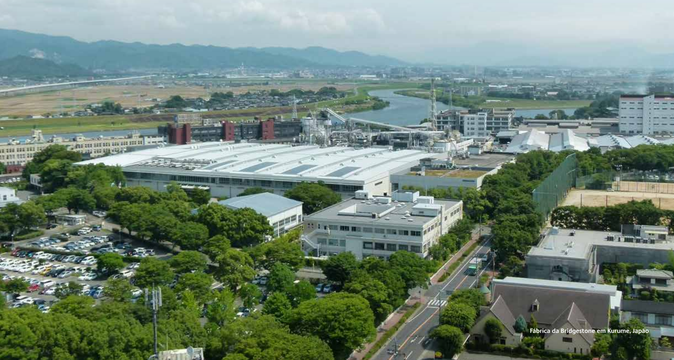
Fábrica da Bridgestone em Kurume, Japão